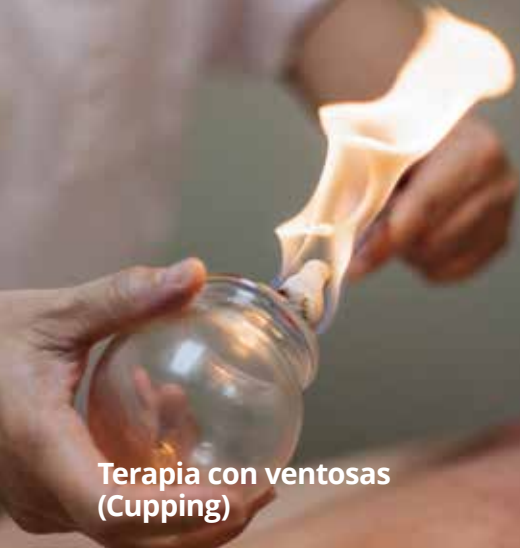
Terapia con ventosas (Cupping)