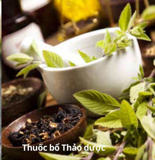
Thuốc bổ Thảo dược

Thái Cực Quyền giúp tăng cường sự trao đổi chất của não và năng lượng cơ bắp ở người lớn tuổi. Nhìn chung, thái cực quyền mang lại nhiều lợi ích cho những người bị viêm xương khớp, đau mỏi, trầm cảm, sợ té ngã, té ngã nói chung và có thể cải thiện việc kiểm soát bệnh tăng huyết áp.