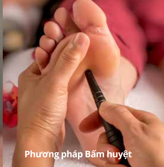
Phương pháp Bấm huyết