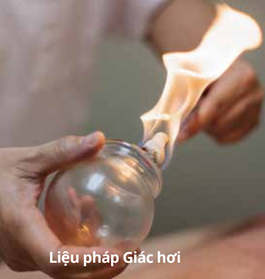
Liệu pháp Giác hơi